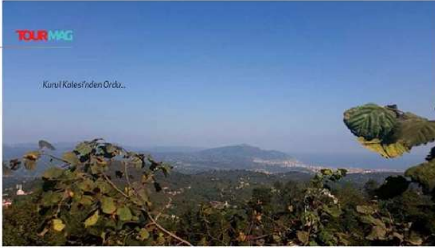
Kurul Kalesi'nden Ordu...